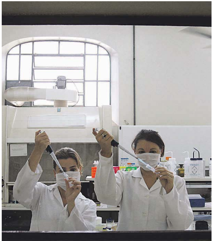
El sector biotecnológico ofrece oportunidades especialmente para los titulados del área científica

Estos sueldos son muy inferiores a los que ofrecen países europeos con más experiencia en el sector biotecnológico, como Alemania o Suiza. Mientras que en España un investigador cobra de media entre 20.000 y 35.000 euros anuales, en Suiza este puesto tiene una remuneración de entre 67.000 y 87.000 euros. La dife-